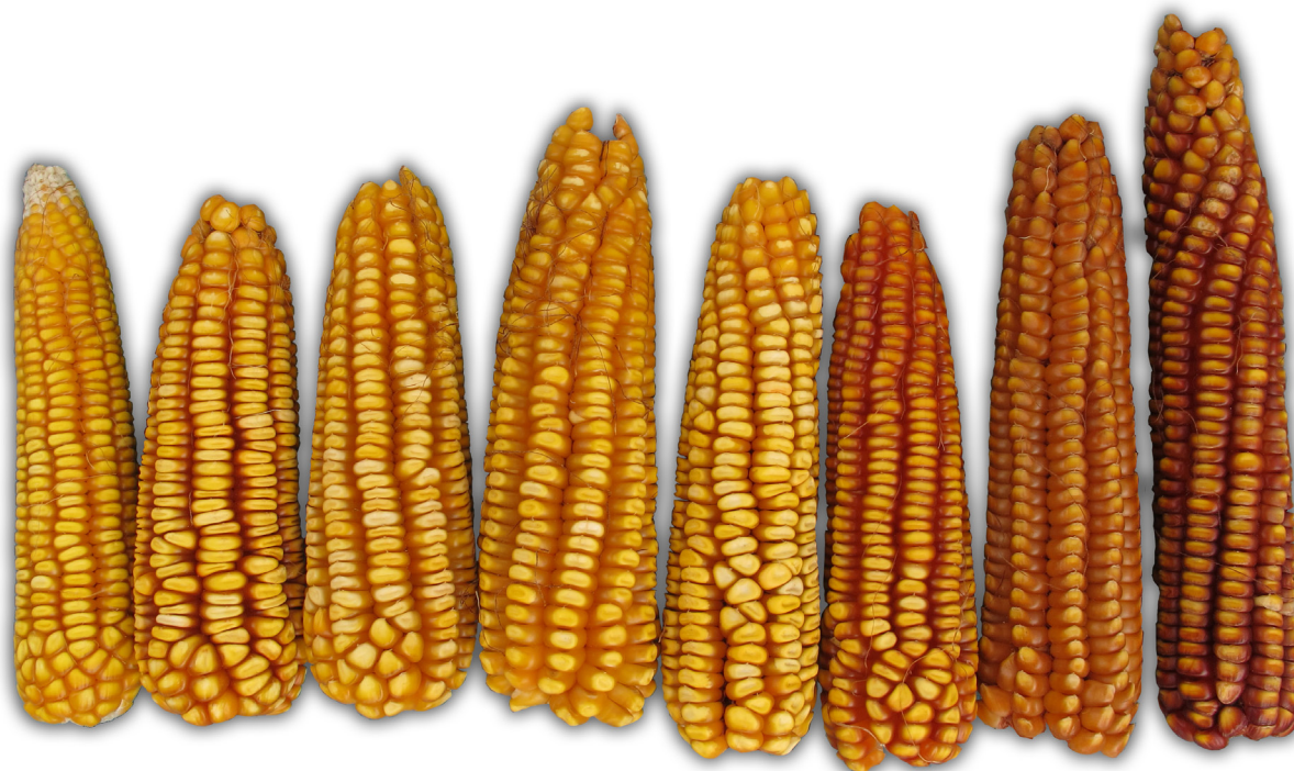
Figura 3. Raza de maíz Zamorano Amarillo, usada como modelo para integrar el patrón heterótico en la formación de híbridos de grano amarillo para la zona de transición en México (1900 a 2200 msnm).