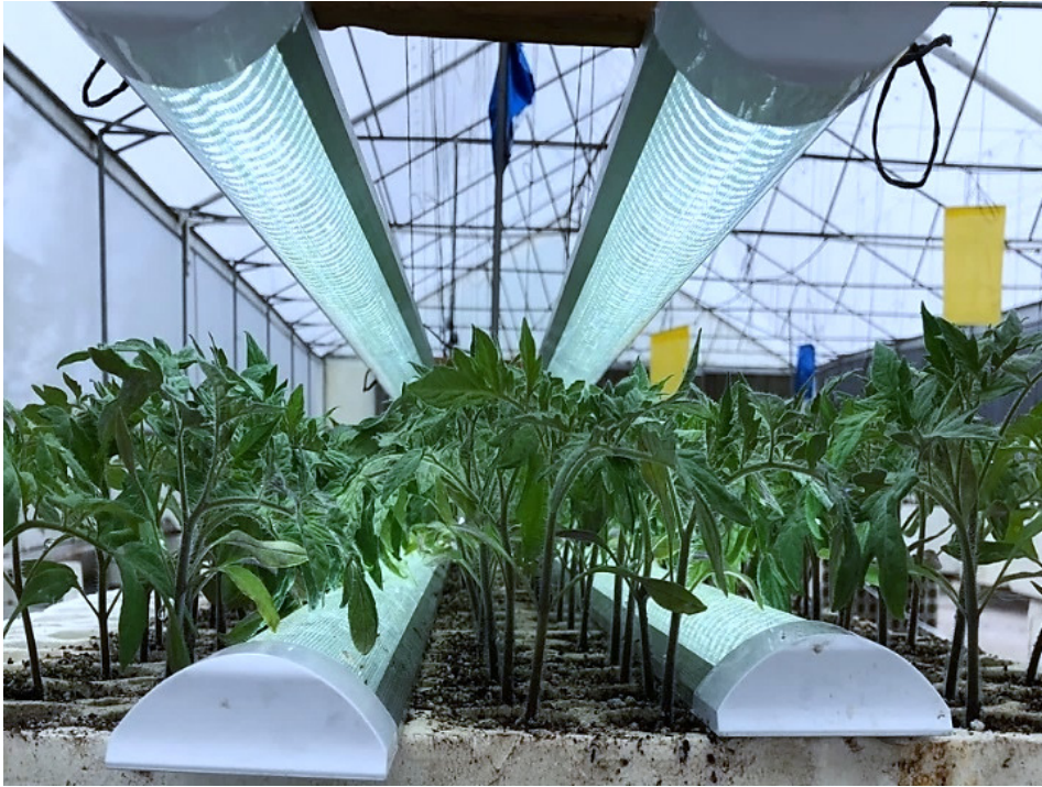
Figura 1. Ubicación de lámparas para iluminar tanto desde arriba como desde abajo del dosel.