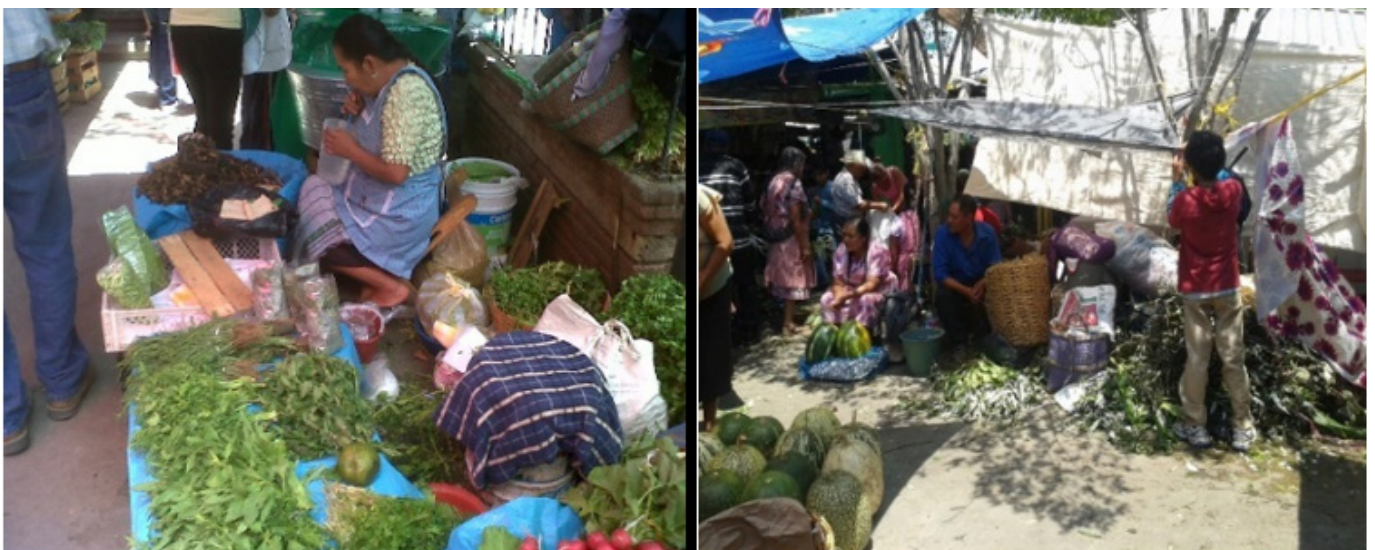
Figura 4. Vendedoras de hierbas aromáticas en el mercado sobre ruedas de Amecameca, México, 2019.