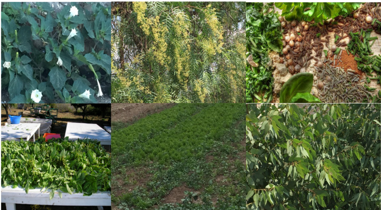
Figura 3. Algunas de las especies de hierbas aromáticas que se venden en el tianguis de Amecameca [toloache ( Datura stramonium ), pirul ( Schinus molle ), cedrón ( Aloysia citriodora ), albahaca y perejil].