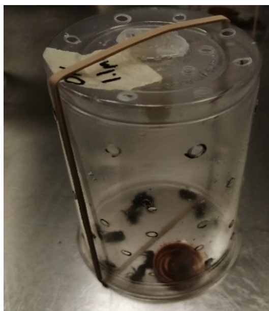
Figura 1. Unidad experimental utilizada.

Se colocó el producto Confidor® en atomizadores calibrados con cinco dosis: 1.00 , 0.066 , 0.033 , 0.011 y 0 \text{ mL L}^{-1} , con y sin el acidificante/coadyuvante DAP Plus®, por lo que se prepararon 10 soluciones. Se aplicó una solución por cámara, lo que generó 70 UE, testigos incluidos, en 10 tratamientos con aplicación de agroquímicos en siete colonias por repetición. Se contabilizó el número de abejas muertas post-aspersión al cabo de 21 lapsos: 5, 15 y 30 min, 1, 1.5, 2, 2.5, 3, 6, 9, 12, 18, 24, 30, 36, 42, 48, 54, 60, 66 y 72